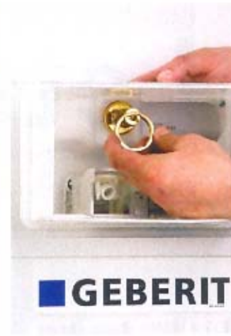
9. Przykręcenie wewnątrz zbiornika zaworu odcinającego