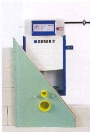
12. Obłożenie elementu płytą gipsowo-kartonową