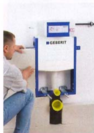
11. Obmurowanie elementu Kombifixu