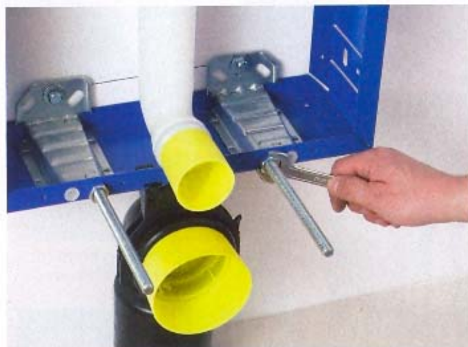
10. Przykręcenie szpilek montażowych do miski ceramicznej