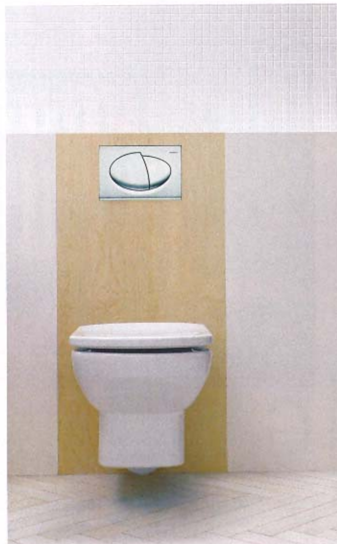
13. Wygląd po zamontowaniu i obłożeniu glazurą