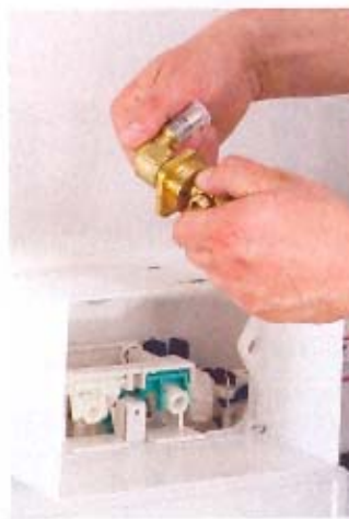
8. Przyłączenie instalacji wodnej do zaworu odcinającego