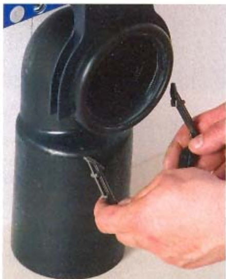
5, 6. Montaż odpływu kanalizacyjnego