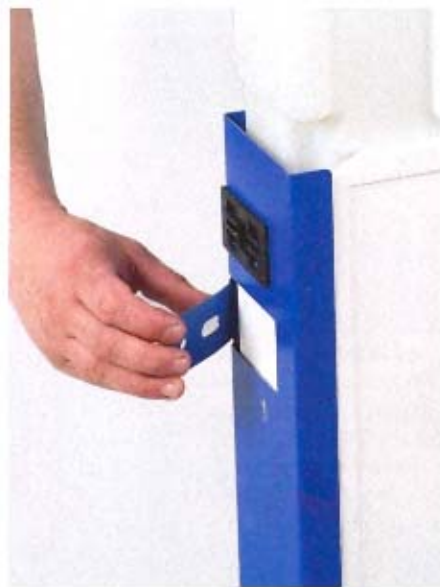
2. Przygotowanie do przykręcenia