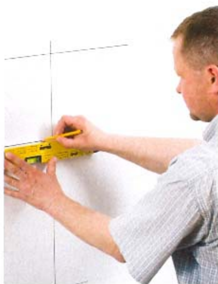
1. Poziomowanie i przygotowanie do montażu