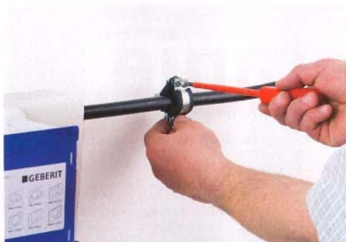
7. Doprowadzenie instalacji wodnej